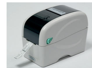
Etikettendrucker und Etikett

Mit dem HÜRNER -Verfahrtaster an der Basismaschine lässt diese sich verfahren, wenn der Schweißer neben ihr steht. Der Schweißprozess wird bequemer, weil man nicht immer wieder zwischen Hydraulikcontroller und Schweißstelle pendelt.